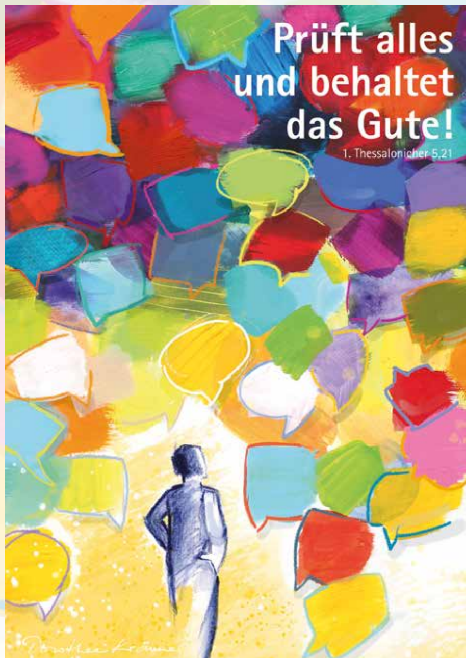
Grafik: Dorothee Krämer