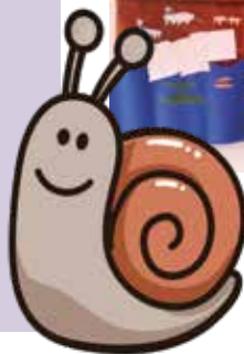
Arche Noah gebastelt im KiGo