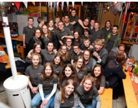
Teamfoto beim 60-Jahre-LÄND-Jubiläum 2017

L: Beim Faschingswagen vor 2 Jahren waren Gerchsheimer dabei und sind dann dazugekommen, da sind einfach persönliche Kontakte.