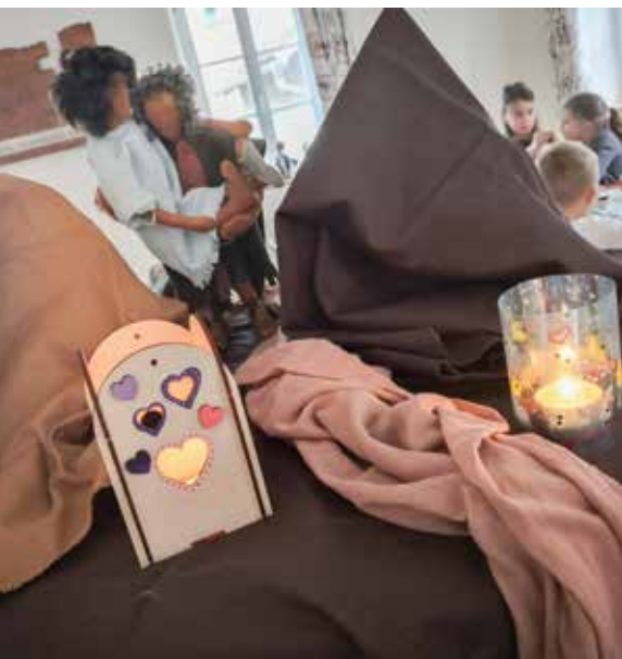
Windlicht gebastelt im KiGo