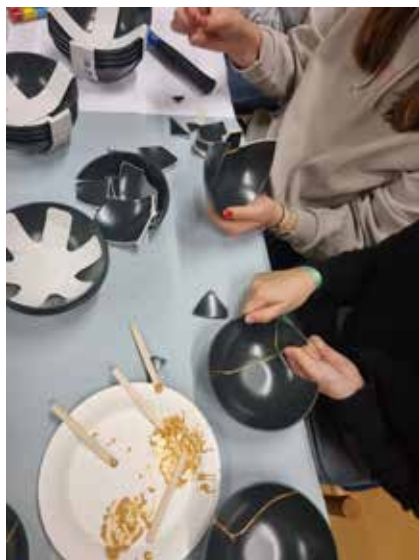
Texte und Bilder: Dennis Stephan

Weitere Events wie die „Aufbruch“- Gottesdienste findet man auf der Seite der Evangelischen Jugend Würzburg.